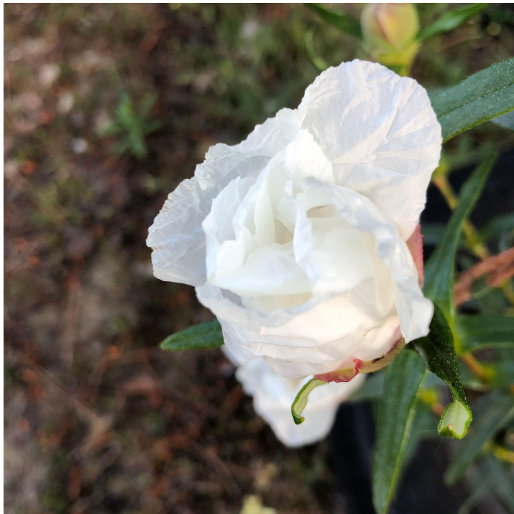
wide white 'utphulla śvetam'

“Dia de Primavera- um vento que vem do mar sem que o mar se veja.”