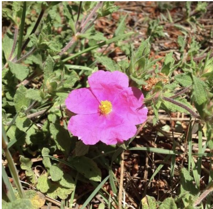
flor do rio | avaniṃ kusumaṃ

Tão fresco o sopro do sino quando chega aqui